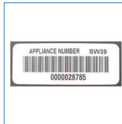
Barcode labels (set van 250 stuks, voorbe- drukt)