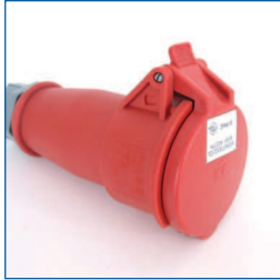
Adapter, 3PNA16 (3-fasen 16A CEE aansluiting, 3 fasen + nul + aarde)