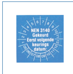
Keuring stickers (set van 100 stuks, diameter 25 mm, met datumaanduiding)