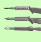
Vario Stekker set