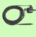
PRO RLO II adapter